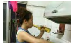
一看就是豪爽的人哪