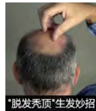
“脱发秃顶”生发妙招